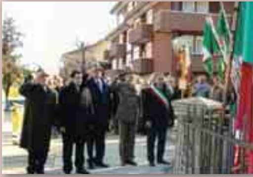
Un momento delle cerimonie nell'Oltrardo

Lo scorso 20 marzo il gruppo Cavarzano-Oltrardo ha celebrato il 46° anniversario di fondazione. Come consuetudine si è trattato di una giornata semplice ma al contempo intensa, caratterizzata dalla deposizione delle corone per onorare i caduti a Cavarzano e alla Rossa, oltre che