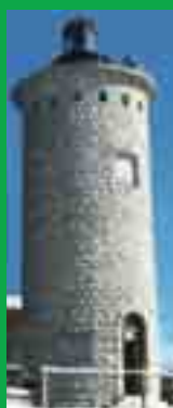
La torretta del sacristia al Col Visentin