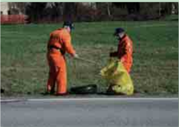
Varie fasi di lavoro per ridare dignità al territorio

A tal proposito De Pra ha sollecitato i capi squadra delle specialistiche (antincendio, telecomunicazioni, rischio idrogeologico, rischio terremoto, logistica e subacquea) ad approfondire le rispettive conoscenze e competenze per una più diffusa ed efficiente professionalità: «Prendiamo esempio dall'intervento sulla sponda del Piave a Borgo Piave: quasi all'unanimità eravamo