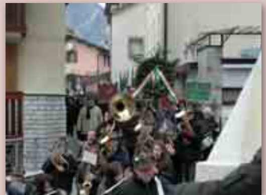
Il corteo accompagnato dal corpo bandistico "A. Boito".