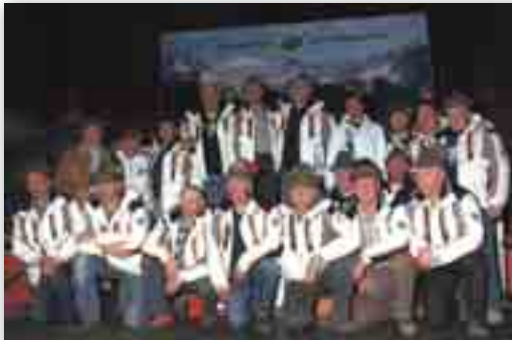
La squadra sezionale di sci alpino "carica" di parecchie medaglie

Al secondo posto di Sezione fanno eco un oro, due argenti ed un bronzo individuali