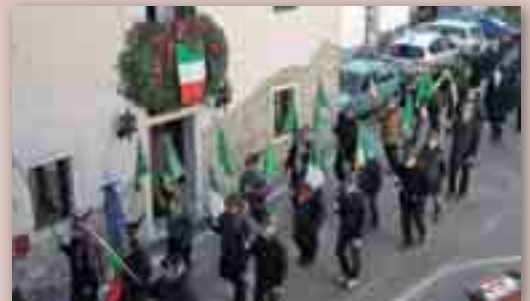
Due fasi della manifestazione alle soglie dell'altopiano del Cansiglio