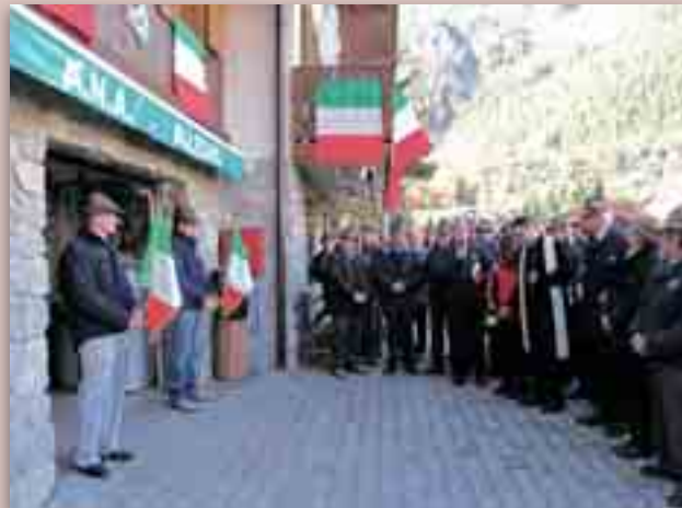
Alpini di Alleghe in assemblea e all'inaugurazione dell'ampliamento della sede del Gruppo