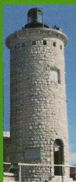
La torretta del sacristia al Col Visentin