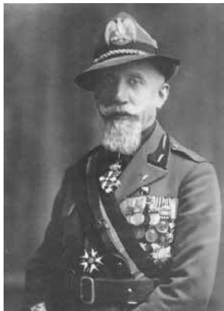
A sinistra il generale Emilio De Bono

La “Canzone del Grappa” è una canzone composta nel 1918 dal generale Emilio De Bono (1866-1944), futuro quadrumviro della Marcia su Roma del 1922.