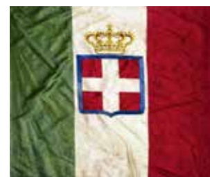
A sinistra la bandiera attuale e a destra quella del Regno d'Italia.