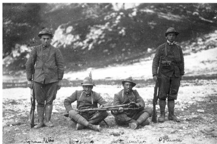
Volontari feltrini e cadorini dietro le trincee della Grande Guerra